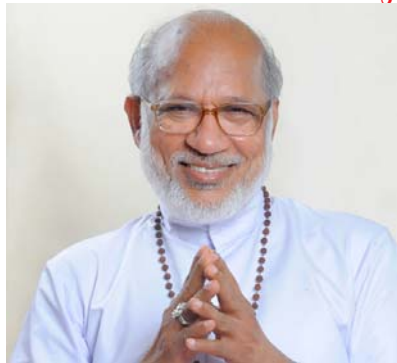
കർദ്ദിനാൾ സ്ഥാനാരോഹണം അല്മായ സാനിഡ്യം റോമിൽ

സീറോ മലബാർ സഭയുടെ മേജർ ആർച്ചുബിഷപ്പ് മാർ ജോർജ്ജ് ആലഞ്ചേരിയെ ബനഡിക്ട് പതിനാറാമൻ മാർപാപ്പ കർദ്ദിനാൾ പദവിയിലേക്ക് ഉയർത്തി. ക്രിസ്തുമസ്സ് ആഘോഷങ്ങളുടെ പരിസമാപ്തി കുറിക്കുന്ന പ്രത്യക്ഷീകരണ തിരുനാളിലെ ( ദനഹാത്തി രൂനാൾ, ജനുവരി 6 ) മധ്യാഹ്ന ജപവേളയിലാണ് മാർപാപ്പ 22 നിയുക്ത കർദ്ദിനാൾമാരുടെ പേരുകൾ പ്രഖ്യാപിച്ചത്. ഫെബ്രുവരി 18 നു വത്തിക്കാനിൽ നടക്കുന്ന കൺസിസ്റ്ററിയിലാണ് കർദ്ദിനാളന്മാരുടെ ഔദ്യോഗിക സ്ഥാനാരോഹണം. മാർപാപ്പാമാരെ തിരഞ്ഞെടുക്കുന്ന കോൺക്ലേവിൽ പങ്കെടുക്കാൻ കർദ്ദിനാൾമാർക്ക് മാത്രമേ സാധിക്കൂ.